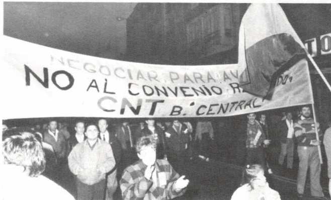
El 27 de marzo convocamos una manifestación en Madrid, exigiendo el cumplimiento de la voluntad mayoritaria del sector.

Ganó el NO, y por bastantes más de los 400 votos que la patronal y mayoritarios reconocieron. A pesar de eso, tras unos ligeros retoques, a finales de abril se sabía que se acabaría por firmar.