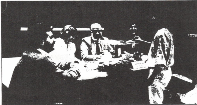
Los trabajadores acudimos confiados a votar el día 4-2-88, seguros de que fuera cual fuera, el resultado sería respetado.

Pocos meses más tarde CCOO, UGT y FITC firmaban un preacuerdo con la patronal que incluía la Jornada Partida, la Movilidad Funcional y la reducción del Complemento de Pensiones. A partir de ahí se sucedieron los enfrentamientos y las discusiones, provocando la activa crítica a ese preacuerdo de los sindicatos y grupos que lo rechazábamos, la decisión de los mayoritarios de convocar un Referéndum para su ratificación.