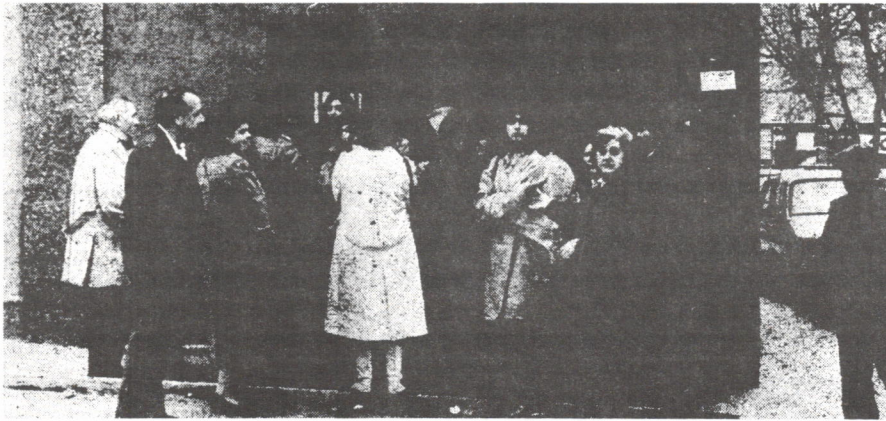
Fotografía del local de la C/ Chantada que, sin estar dado de alta, no disponer de teléfono ni alarma, atendía el pago del desempleo entre el 10 y el 15 de cada mes. Las colas, que empezaban a formarse el día anterior, podían llegar a congregarse alrededor de 300 personas.

De catastrófica se puede calificar la gestión de los responsables de la seguridad en el Banco Central. Famosas son las circulares calificando de «sospechosos» a todas las personas de edades comprendidas entre los 17 y 35 años. Notable la que ordenaba no abrir la puerta de las oficinas blindadas aunque hubiera clientes amenazados de muerte. Contumaces los intentos de responsabilizar a los empleados de los atracos que se cometen acusándoles de negligencia. Provocadoras las instrucciones de mantener las oficinas abiertas inmediatamente después de sufrir un atraco.