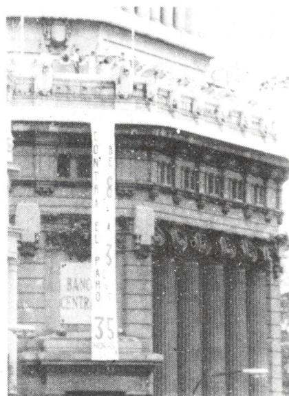
Pancarta colocada en la fachada de la Oficina Principal de Madrid el 15 de agosto. Lucieron también sendas pancartas las sedes de los principales bancos.

Ante esta dilatación sin excusa de las negociaciones, y ante la pasividad más absoluta por buscar una salida justa y digna al Convenio por parte de estos sindicatos, la C.N.T. ha visto necesario el seguir movilizándose continuando sus acciones durante el mes de agosto.