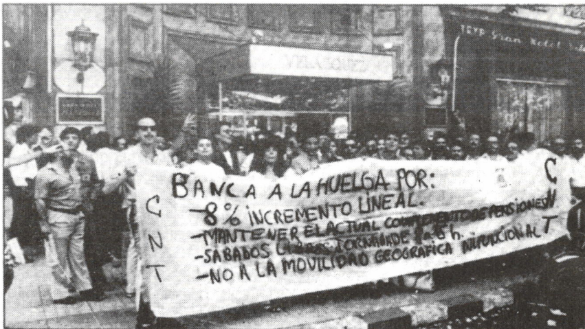
Delegados de CNT ante la sede de la negociadora.

¿Y qué decir de la huelga teleconvocada? ¡Qué fuerte! No sólo los banqueros consegu-